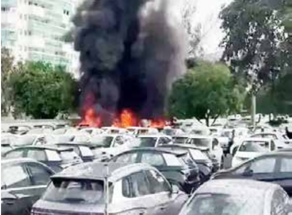
રિયો ડી જેનેરિયો, તા.15

બ્રાઝીલ, તા.15 બ્રાઝીલના રિયો ડી જેનેરિયોમાં રિવારે સવારે બે હેલિકોપ્ટર હવામાં એકબીજા સાથે ટકરાઈને ઘુર્ણતાગ્રસ્ત થઈ ગયા. બંને હેલિકોપ્ટર શહેરના પશ્ચિમી વિસ્તારમાં આવેલા એક ઈલેક્ટ્રિક વીકલ (EV) ડીલરશિપના પાર્કિંગમાં જઈને ખાબક્યા. આ અકસ્માતમાં છ લોકોના મોત થયા છે. મૃતકોમાં અમેરિકન ગાયક અને હાસ્ય કલાકાર (કોમેડિયન) ઓલિવર ટ્રી પણ સામેલ હોવાની આશંકા પોલીસે વ્યક્ત કરી છે, જો કે મૃતદેહોમાં તેમની ઓળખ હજુ સુધી થઈ શકી નથી. ફાયર બ્રિગેડના જણાવ્યા અનુસાર, ટક્કર બાદ હેલિકોપ્ટરોમાં આગ લાગી ગઈ હતી, જે જોતજોતામાં પાર્કિંગમાં ઉભેલી ગાડીઓ સુધી ફેલાઈ ગઈ. આગની જપેટમાં આવવાને કારણે ઓછામાં ઓછા 20 વાહનો બળીને ખાખ થઈ ગયા. સ્થાનિક મીડિયાના જણાવ્યા મુજબ, એક હેલિકોપ્ટર જમીન પર પડવાની સાથે જ બ્લાસ્ટ થઈ ગયું હતું, જેના કારણે આસપાસ ઉભેલી ઈલેક્ટ્રિક ગાડીઓમાં પણ આગ લાગી ગઈ. અકસ્માત બાદ વિસ્તારમાં કેટલાય વિસ્ફોટોના