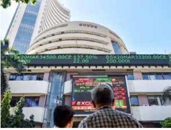
મોટો સપોર્ટ મળ્યો હતો.

ભારતીય શેરબજારમાં અગાઉના દિવસના ભારે ઘટાડા બાદ આજે એટલે કે 9 જૂને શાનદાર રિકવરી જોવા મળી છે. સ્થાનિક રોકાણકારોની ખેરદાર ખરીદી અને વૈશ્વિક બજારોમાંથી મળેલા હકારાત્મક સંકેતોને કારણે બજાર ફરી એકવાર લીલા નિશાન પર બંધ થવામાં સફળ રહ્યું. બોમ્બે સ્ટોક એક્સચેન્જનો મુખ્ય ઇન્ડેક્સ સેન્સેક્સ આજે 395 પોઈન્ટના આકર્ષક ઉછાળા સાથે 73,919 ના સ્તરે બંધ થયો હતો. તેવી જ રીતે નેશનલ સ્ટોક એક્સચેન્જનો ઇન્ડેક્સ નિફ્ટી પણ 119 પોઈન્ટ મજબૂત થઈને 23,242 ના સ્તર પર પહોંચી ગયો હતો. આજના કારોબાર દરમિયાન ખાસ કરીને ઓટોમોબાઈલ, બેન્કિંગ અને રિયલ્ટી સેક્ટરના શેરોમાં રોકાણકારોએ વ્યાપક ખરીદી રસ દાખવ્યો હતો, જેના કારણે બજારને