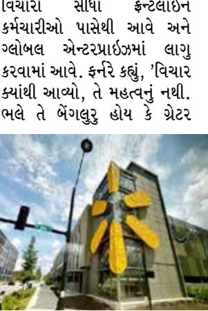
વોલમાર્ટનો ઓપરેશનમાં AIનો ઉપયોગ કરવામાં આવે છે.

ગ્લોબલ રિટેલ ચેઇન વોલમાર્ટની વાર્ષિક મીટિંગમાં એ સ્પષ્ટ થઈ ગયું છે કે કંપની બિઝનેસની ગતિ વધારવા માટે AIને સૌથી મોટું હથિયાર બનાવી રહી છે. દુનિયાભરમાં ફેલાયેલા હજારો સ્ટોર, કરોડો સાપ્તાહિક ગ્રાહકો અને 20 લાખથી વધુ કર્મચારીઓ ધરાવતી આ કંપની હવે સ્ટોરની અંદર ઓર્ડર પીકિંગથી લઈને ડિલિવરી ટાર્ગેટિંગ અને કસ્ટમર ફીડબેક સમજવા સુધીના દરેક નાના-મોટા ઓપરેશનમાં AIની મદદ લઈ રહી છે. વોલમાર્ટના સીઈઓ જોન ફર્નરે કહ્યું કે કંપનીનો લક્ષ્ય AI શીખવા અને તેની ક્ષમતાને બાદ માટે સુલભ બનાવવાનો છે. ફર્નરેનો આગ્રહ છે કે કંપનીનો દરેક કર્મચારી AI ટૂલ્સ શીખે અને આગળ વધે. મીટિંગમાં સૌથી વધુ ચર્ચા 'કોડ પીપી' ટૂલની રહી, જેને વોલમાર્ટ ગ્લોબલ ટેકના એન્જિનિયરોએ જ વિકસાવ્યું છે. આ એક એવું 'વાઈબ-કોડિંગ ટૂલ' છે જે તમામ કર્મચારીઓને પોતાના સ્તરે ટેકનિકલ સોલ્યુશન્સ શોધવામાં મદદ કરે છે. વોલમાર્ટનો પ્રયાસ છે કે નવા