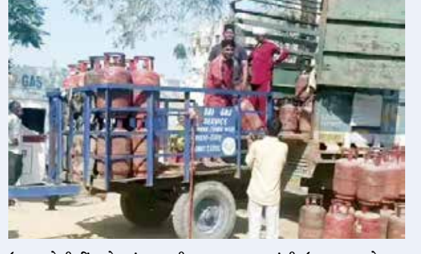
ઉત્પાદનનો કિંમતો આંતરરાષ્ટ્રીય બજાર સાથે જોડાયેલી છે. આમ છતાં, સરકાર ઘરેલુ એલપીજીની કિંમતોને નિયંત્રિત રાખે છે.

આ દરમિયાન સરકારનું કહેવું છે કે દુનિયાભરમાં ફૂડ ઓઈલ અને ગેસના ભાવમાં વધઘટ વચ્ચે ભારતીય પરિવારોને સૌથી સસ્તી રસોઈ ગેસ મળી રહી છે. ભારતમાં ઘરેલું એલપીજી (LPG) સિલિન્ડરની કિંમત પડોશી દેશો અને અમેરિકા, ઓસ્ટ્રેલિયા જેવા એડવાન્સ અર્થતંત્રોની સરખામણીમાં ખૂબ ઓછી છે. વર્તમાનમાં આંતરરાષ્ટ્રીય બજારમાં વધતી ખર્ચનો બોજ સરકાર પોતે ઉઠાવી રહી છે અને તેને સામાન્ય ગ્રાહકો પર પાસ-ઓન થવા દેવામાં આવ્યો નથી. ભારતમાં પેટ્રોલિયમ