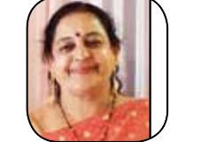
સદગુરુ વરનામૃત સંકલન ફાલ્ગુની વસાવડા (ભાવનગર)

આપનાં શ્રીચરણોમાં મારાં સહ પરિવાર સાદર સાષ્ટાંગ પ્રેમ પ્રણામ. આજે શુક્રવાર એટલે કે ઉપનિષદોળ જ્ઞાનનો સહજ સરળ અર્થ કરી વ્યવહાર જગતમાં સ્થાપી જીવનને શાંતિ પ્રદાન કરવાનો દિવસ. આજનાં સમયને શિક્ષણ અને સંશોધનનો સમય કહેવામાં આવે છે. હાં શિક્ષણમાં સ્પર્ધા પ્રવેશી ગઈ છે, અને શિક્ષણે એક વ્યવસાયનું સ્થાન લઈ લીધું છે, એ એક વાત જાણી છે. શિક્ષણની કેટકેટલી શાખાઓમાં આજે વિદ્યાર્થીઓ સ્નાતક થઈ પોતાની કેરિયર બનાવી રહ્યાં છે અને, માનવ જીવનને કેમ વધુ ને વધુ સુખ સુવિધા પૂરી પાડવી! એ ઉપરાંત દરેકની જરૂરિયાતને પૂરી કરી રીતે કરી શકાય! તેમજ બદલાતાં પ્રાકૃતિક સમીકરણોમાં મનુષ્ય પોતાની જાતને કંઈ રીતે ગોઠવી શકે! એટલે કે એને અંતરિક્ષ જેમ ઓછાં ઓક્સિજન, પાણી, કે ખોટાક સાથે જીવન જીવવું પડે તો શું કરવું! કે પછી સતત સામાજિક અશાંતિના વાતાવરણમાં શાંતિ કંઈ રીતે મેળવી શકાય, એ માટે આપણાં વૈદિક શાસ્ત્રો પર સંશોધન થાય છે! આજે વિદ્યાર્થીઓ માત્ર અક્ષરજ્ઞાન પ્રાપ્ત કરે છે, પરંતુ વૈદિક શાસ્ત્રોનાં મંથનથી સાચું જ્ઞાન પ્રાપ્ત થાય છે. આપણે ચોથા ઉપનિષદ મુંડકનાં ત્રીજા ભાગમાં શું કહેવામાં આવ્યું છે, અને ઋષિ દ્વારા સાધકને બ્રહ્મ જ્ઞાનની સહજ સમજ કંઈ રીતે આપવામાં આવી છે, એનાં મહત્વનાં શ્લોક વિશે વાત કરીશું.