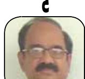
વિશેષ યશપાલસિંહ ડી. વાલેલા (દર

ભારતીય સનાતન પરંપરામાં પુરુષોત્તમ માસ એટલે કે અધિક માસને સ્વયં ભગવાન શ્રીકૃષ્ણે પોતાનું નામ આપીને સર્વોત્તમ બનાવ્યો છે. આ માસમાં દરવામાં આવેલું જપ, તપ, દાન અને કથા-શ્રવણ અનેકગુણ જી આપે છે. આવા પાવન માસના મહાત્મ્યમાં 13મો અધ્યાય ખાસ મહત્વ ધરાવે છે. આ અધ્યાયમાં વર્ણવાયેલી દૃઢધત્વા રાજાની કથા માત્ર એક પૌરાણિક પ્રસંગ નથી, પણ દરેક જીવાત્માને પોતાના અસ્તિત્વના મૂળ પ્રશ્નો તરફ દોરી જતી ચાવી છે. 'હું કોણ છું? મારા દુઃખ-સુખનું કારણ શું? કર્મોનું રહસ્ય શું?' આવા સનાતન પ્રશ્નોના જવાબ આ અધ્યાયમાં મહર્ષિ વાલ્મીકિ દ્વારા સરળ ભાષામાં આપવામાં આવ્યા છે. આ કથા કર્મ, જ્ઞાન અને ભક્તિના ત્રિવેશી સંગમ સમાન છે, જે જીવને સંસારના આવરણમાંથી બહાર કાઢીને પ્રભુના ચરણો સુધી પહોંચાડે છે.