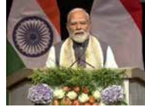
હેમ, તા.16 પીએમ નરેન્દ્ર મોદી નેધરલેન્ડની મુલાકાતે છે. હેગમાં ભારતીય સમુદાયને સંબોધતા,

તેમણે દુનિયાની વર્તમાન પરિસ્થિતિ અંગે ચિંતા વ્યક્ત કરી. મોદીએ કહ્યું કે આજે માનવતા ધણા મહત્વપૂર્ણ પડકારોનો સામનો કરી રહી છે. પહેલા કોરોના, પછી યુદ્ધ અને હવે ઉર્જા સંકટ સામે જગૃમી રહી છે. આ દાયકો વિશ્વ માટે આફતોનો દાયકો બની ગયો છે. જો પરિસ્થિતિ બદલાશે નહીં તો અનેક દાયકાઓના કામ પર પાણી ફરી જશે. વિશ્વની મોટી