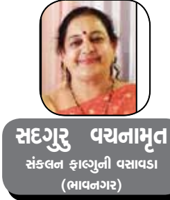
સદગુરુ વયનામૃત સંકલન ફાળવેલી વસાવડા (ભાવનગર)

તોડવા માટે ખૂબ ઊંડું રાજકારણ રચ્યું છે! અને આ હોમીઓનો દરિયાઈ માર્ગે આવતા આપણાં સમુદ્રી જહાજોની અનિયમિતતા વધતી જાય છે! ઉપરથી હવે કુડ ઓઈલનો જથ્થો મેળવવો આર્થિક રીતે પણ મોંઘુ પડતું જાય છે! આગ લાગે ત્યારે કૂવો ખોદવા બેસાય નહીં! એ મુજબ આપણાં વડાપ્રધાન એ જનતાને અમુક વસ્તુઓ વિવેકથી કે કરકસરથી વાપરવાની અપીલ કરી છે! તો આપણે આજે એની પર વાત કરીશું! કારણ કે પેટ્રોલિયમ પ્લાનિંગ એન્ડ એનાલિસિસ સેલઅનુસાર, નાણાકીય વર્ષ 2025-26માં, ભારતે કુડઓઈલ અને પેટ્રોલિયમ ઉત્પાદનોની આયાત પર 144 બિલિયન અમેરિકન ડોલરનો ખર્ચ થયો. પીએમ મોદીએ ભારતીયોને પેટ્રોલ અને ડીઝલમાં કરકસર કરવા, સોનું ખરીદવાનું ટાળવાં અને એક વર્ષ સુધી રસોઈ માટેનું તેલ ઓછું વાપરવાની સાથે, આ સમયગાળા દરમિયાન લોકોને વિદેશયાત્રા ટાળવાની પણ અપીલ કરી. ભારતીય જનતા પાર્ટીનાં અનેક નેતાઓએ પીએમનાં ભાષણને શેર કર્યું અને તેમની અપીલનો પુનરોચ્ચાર કરી પોતાની સહમતી દર્શાવી આ વાતને પૂર્ણ ટેકો આપ્યો. અન્ય ક્ષેત્રોમાં મહાનુભાવોએ વડા પ્રધાનનાં ભાષણને ટાંકીને કહ્યું કે આનવાનું દિવસો હજી પણ વધુ કોટકટી ભર્યાં હોય, એવું વિચારીને ભારતને મુશ્કેલ સમય માટે તૈયાર રહેવું જોઈએ. તેમજ વિપક્ષે પોતાની ટેવ મુજબ સરકારને નિષ્ફળ ગણાવી અને કહ્યું કે ઈરાન યુદ્ધથી ઊભી થયેલી પરિસ્થિતિને સરકાર યોગ્ય રીતે હેન્ડલ કરી શકી નહીં, અને એટલે આ મુશ્કેલીને સંભાળવાની