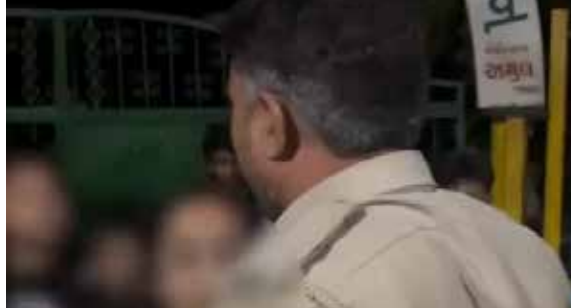
લગાવવામાં આવ્યો છે. પોલીસકર્મીઓએ બાળકો પર ચોરીનો ખોટો આરોપ લગાવી પોલીસ સ્ટેશન લઈ જવાની ધમકી આપી હતી અને તેમના પરિવારને સ્થળ પર બોલાવ્યા હતા. બાળકોના પરિવારની યુવતીઓ અને મહિલાઓ જ્યારે સ્થળ પર પહોંચી, ત્યારે તેમણે પોલીસની આ ગેરવર્તણૂકનો વીડિયો ઉતારવાનું શરૂ કર્યું હતું. આ જોઈને પોલીસકર્મીઓએ યુવતીના હાથમાંથી મોબાઈલ ખેંચી

અમદાવાદના વાસણા વિસ્તારમાં પોલીસની કામગીરી સામે ગંભીર સવાલો ઉઠ્યા છે. ગાર્ડનમાં રમવા ગયેલા બે સગીર બાળકો પર પોલીસકર્મીઓએ હાથ ઉઠાવ્યો હોવાનો અને વીડિયો ઉતારતી યુવતીઓ સાથે ગેરવર્તણૂક કરી ઝપાઝપી કર્યાનો આક્ષેપ કરવામાં આવ્યો છે. આ સમગ્ર ઘટનાના વીડિયો પણ સામે આવ્યાં છે, જેમાં રોષે ભરાયેલી યુવતી પોલીસકર્મીને ગાળો ભાંડી રહી છે. આ ઘટના બાદ યુવતીએ પોલીસ કમિશનરને લેખિત અરજ કરી કડક કાર્યવાહીની માગ કરી છે. પોલીસ કમિશનરને કરાયેલી અરજ મુજબ, 8 મે, 2026ની રાતે અંદાજે 11 વાગ્યાની આસપાસ વાસણાના સિનિયર સિટીઝન પાર્ક પાસે 9 અને 11 વર્ષના બે સગીર બાળકો રમવા ગયા હતા. ગાર્ડનનો દરવાજો ખુલ્લો હોવાથી બાળકો