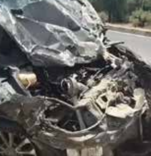
બોલી ગયો હતો અને તેના પર સવાર ત્રણેય યુવાન હવામાં ફંગોળાયા બાદ ગંભીર ઈજાઓ થવાને કારણે સ્થળ પર જ દમ તોડી દીધો હતો. ઘટનાની જાણ થતા જ સ્થાનિક લોકોના ટોળેટોળા ઉમટી પડ્યા હતા. પોલીસકાલ્કો તાત્કાલિક ઘટનાસ્થળે પહોંચી ગયો હતો અને પરિસ્થિતિ પર કાબૂ મેળવ્યો હતો. પોલીસે ત્રણેય મૃતદેહનો કબજો સંભાળી, ઘટનાસ્થળનું પંચનામું કર્યું હતું. ત્યાર બાદ મૃતદેહોને પોસ્ટમોર્ટમ અર્થે ગોધરા સિવિલ હોસ્પિટલ ખાતે ખસેડવામાં આવ્યા છે.

પંચમહાલ જિલ્લાના ગોધરા-અમદાવાદ હાઈવે પર આજે (10 મે) વહેલી સવારે એક અત્યંત દુઃખદાયક અકસ્માત સર્જાઈ હતી. ગોધરા નજીક આવેલા વાવડી પુર્વ પાસે, બેફામ ગતિએ દોડતી એક કારે બાઈકસવાર ત્રણ યુવાનને કચડી નાખતાં ત્રણેયના ઘટનાસ્થળે જ કમકમાટીભર્યાં મોત નીપજ્યાં છે. આ અકસ્માતને પગલે સ્થાનિક પંચકમાં ભારે અરેરાટી વ્યાપી ગઈ છે. આ સમગ્ર ઘટનાના CCTV પ્લાન સામે આવ્યા છે. જેમાં જોઈ શકાય છે કે, રોડ ક્રોસ કરી રહેલી એક બાઈકને પૂરપાટ ઝડપે આવી રહેલી એક કારે જોરદાર ટક્કર મારી હતી. જેમાં બાઈક પર સવાર ત્રણેય મિત્ર હવામાં ફંગોળાયા બાદ ઘટનાસ્થળે જ મોતને ભેટી હતી. મળતી માહિતી મુજબ, ગોધરા-અમદાવાદ હાઈવે પર વાવડી પુર્વ પાસે આવેલી ચામુંડા હોટલ નજીક આ અકસ્માત સર્જાયો હતો. આજે વહેલી સવારે જ્યારે વાતાવરણ શાંત હતું, ત્યારે પૂરપાટ ઝડપે આવી રહેલી એક કારના ચાલકે માર્ગ પરથી પસાર થઈ રહેલી બાઈકને જોરદાર ટક્કર મારી હતી ટક્કર એટલી ભયાનક હતી કે, બાઈકનો કુરચો