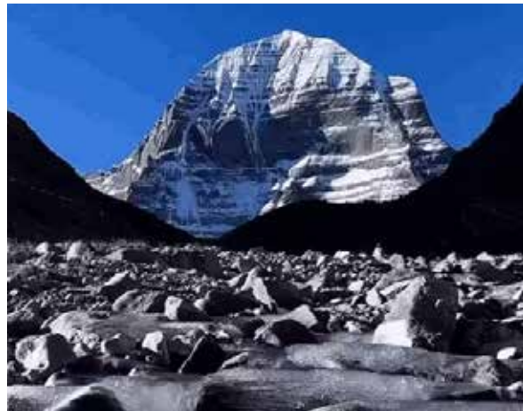
લગભગ 35 હજાર શ્રદ્ધાળુઓએ આદિ કેલાસના દર્શન કર્યા હતાં.

જથ્થાને રવાના કર્યો. આ જથ્થો લગભગ 140 કિલોમીટરનો પ્રવાસ કરીને આદિ કેલાસ પહોંચશે, જ્યાં શ્રદ્ધાળુઓ પાર્વતી સાથે રજા કરશે. યાત્રાના શુભારંભ દરમિયાન આખું વાતાવરણ શિત્તમય બની ગયું. શિવભક્તોએ “હર-હર મહાદેવ”ના જયઘોષ સાથે યાત્રા શરૂ કરી. પ્રશાસન દ્વારા સુરક્ષા, સ્વાસ્થ્ય અને વાહનવ્યવહાર સંબંધિત તમામ જરૂરી વ્યવસ્થા પહેલેથી જ સુનિશ્ચિત કરવામાં આવી છે, જેથી શ્રદ્ધાળુઓ સુરક્ષિત યાત્રા કરી શકે. 2025માં