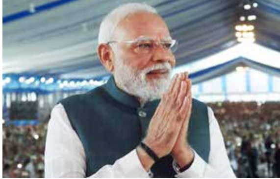
બીજા દિવસે 11મી મેએ PM મોદી સોમનાથ મંદિરની પ્રાણપ્રતિષ્ઠાના 75 વર્ષ પૂર્ણ થવાના અવસરે 'સોમનાથ અમૃત મહોત્સવ'માં સહભાગી થશે. જેને લઈ સોમનાથમાં દિવાળી જેવો માહોલ છે. સૂર્યકિરણ એર શો: PM મોદીના આગમન પહેલાં

એરફોર્સ સ્ટેશનથી લાલ બંગલા સર્કલ સુધીના માર્ગને લાઈટિંગ અને બેનરોથી શણગારવામાં આવ્યા છે. લાલ બંગલા પાસે એક વિશાળ સ્ટેજ બનાવાયું છે, જ્યાંથી પીએમ નાગરિકોનું અભિવાદન ઝીલશે. સુરક્ષા વ્યવસ્થા: SPG અને બોમ્બ સ્વૉડ દ્વારા સમગ્ર શહેરનું નિરીક્ષણ કરવામાં આવ્યું છે. લોકોમાં વડાપ્રધાનના આગમનને લઈને અનેરો ઉમંગ જોવા મળી રહ્યો છે. 2. સોમનાથ: અમૃત પર્વ પર આકાશમાં 'સૂર્યકિરણ'ની ગર્જના અને રોશનીનો જળહળાટ