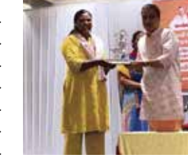
હતી. નાયબ મુખ્યમંત્રીએ પ્રોટોકોલ બાજુ પર મૂકીને સમાજના વડીલોને સર્વોપરી સ્થાન આપ્યું હતું. કેલાશજી સહિતના પાંચ વડીલોના હસ્તે ડ્રો સિસ્ટમ દ્વારા વિજેતાઓના નામ નક્કી કરવામાં આવ્યા હતા. આ પારદર્શક પદ્ધતિ દ્વારા વડીલોએ ઉઠાવેલી ચિઠ્ઠીમાં જે ટોચનાં નંબર નીકળ્યો, તે ભાગ્યશાળી કાર્યકર્તાઓને હર્ષ સંઘવીના હસ્તે સ્મૃતિ ચિન્હ કે ઉપહાર આપી સન્માનિત કરવામાં આવ્યા હતા. હર્ષ સંઘવીએ પોતાના સંબોધનમાં યૂંટાયેલા કોર્પોરેટરો અને હોદ્દેદારોને ટકોર કરતા

સુરતના રાજકારણમાં સેવા અને નમ્રતાનો આજે એક અનોખો કિસ્સો જોવા મળ્યો છે. મજૂરા વિધાનસભા વિસ્તારમાં આયોજિત જનસેવા સાથે ઉપહાર વિતરણ કાર્યક્રમમાં નાયબ મુખ્યમંત્રી હર્ષ સંઘવીએ જનતા અને કાર્યકર્તાઓ તરફથી મળેલા તમામ સન્માન અને ભેટ-સોગાદા કરી જનતાના ચરણોમાં અર્પણ કરી દીધી હતી. આ વિતરણ માટે તેમણે 'ડ્રો સિસ્ટમ' અપનાવી હતી જેથી કોઈ પક્ષપાત ન થાય અને સૌને સમાન તક મળે. આ પ્રસંગે તેમણે યૂંટાયેલા પ્રતિનિધિઓને સત્તાના અહંકારથી દૂર રહી લોકસેવા કરવા પર ભાર મૂક્યો હતો. સાથે જ કહ્યું કે, કોર્પોરેટર બન્યાનો ભાર મગજમાંથી ઉતારી નાખજો, જનતા અને સંગઠન પાંચ વર્ષ પછી હિસાબ કરશે. કાર્યક્રમની શરૂઆત અત્યંત લાગણીસભર રહી