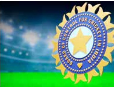
રાધા યાદવ, મંધાના-શેફાલી ઓપનર, નંદની પહેલો વર્લ્ડકપ રમશે ભારતીય ટીમના ટોપ મહત્વની ભૂમિકા ભજવશે. રિયા ઘોષને વિકેટકીપર તરીકે પસંદ કરવામાં આવી છે. તે મેચની રેથ ઓવર્સમાં મોટા શોટ

T20 કેપ્ટન હરમનપ્રીત કૌર, કોચ અમોલ મજુમદાર, પસંદગી સમિતિના અધ્યક્ષ અમિતા શર્મા અને BCCI સેક્રેટરી દેવજીત સૈકિયા હાજર રહ્યા. T20 વર્લ્ડ કપ માટે ભારતીય ટીમ હરમનપ્રીત કૌર (કેપ્ટન), સ્મૃતિ મંધાના, શેફાલી વર્મા, જેમિમાહ રોડ્રિગ્સ, દીપ્તિ શર્મા, રિયા ઘોષ (વિકેટકીપર), ભારતી ફુલમાળી, શ્રી ચરણી, યાસ્તિકા ભાટિયા, નંદની શર્મા,