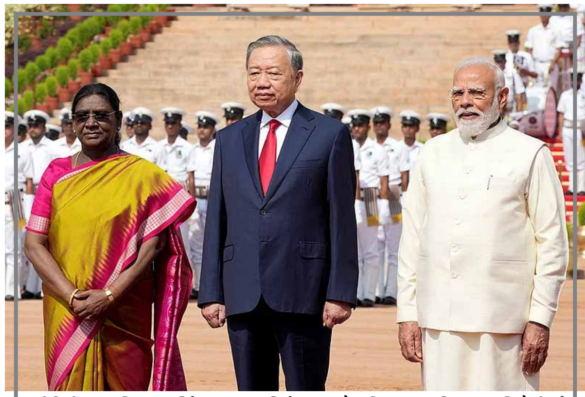
નવી દિલ્હીમાં રાષ્ટ્રપતિ ભવનમાં વિયેતનામના રાષ્ટ્રપતિ તો લામના ઔપચારિક સ્વાગત દરમિયાન રાષ્ટ્રપતિ દ્રૌપદી મુર્મુ અને વડા પ્રધાન નરેન્દ્ર મોદી, મધ્યમાં.