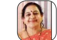
સદગુરુ વરનામૂર્તિ સંકલન ફાળોની વસાવડા (ભાવનગર)

પશ્ચિમ બંગાળ, આસામ, અને પોંડિચેરી એમ પાંચ રાજ્યમાં વિધાનસભાની ચૂંટણીનું પરિણામ આવી ગયું અને જીતના એ આ વખતે પોતાનો ટેસ્ટ બદલ્યો હોય એમ યુનાવનું પરિણામ આવ્યું! કોઈ પણ પ્રકારની ચૂંટણી હોય ત્યાં કોઈની જીત અને કોઈની હાર નિશ્ચિત છે! પરંતુ હા યુનાવ પર આધાર છે કે યોગ્યની જીત થઈ છે કે નહીં! જો જીતના ખોટાં પક્ષ કે ઉમેદવાર ને યુને તો એમાં નુકસાન પોતાનું જ છે! એ વાત હવે ચૂંટણીનાં પરિણામો પરથી દેખાય છે! કારણ કે પહેલાં તો આટલું જંગી મતદાન થયું એ જ ઘણું સાચું કહેવાય! જોકે હજી પણ અમુક ટકાનાં મત ખોટાં પડે છે! વ્યક્તિને મત સ્વાતંત્ર્યનો પૂરો અધિકાર છે! પણ હજી અપવાદ રૂપે મતની લે વેચ થાય છે ખરી! ચિંતન ને કોણ જાણ્યું! કોણ હાણ્યું! યોચ છે કે નહીં! એની સાથે કોઈ મતલબ નથી, એટલે કે આ વિશ્લેષણ રાજકીય સિદ્ધિ માટે નથી, પરંતુ યુનાવ એ એક એવું પરિબલ છે, જેનાથી આપણી જીંદગી સુધરી પણ શકે! અને તબાહ પણ થઈ શકે! અને આમાં ધનવાન ગરીબ, કે સ્ત્રી પુરુષ એવો કોઈ ભેદ નથી! દાખલા તરીકે દરેકની વિદ્યાર્થી