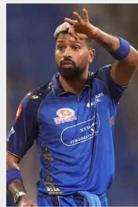
આવી નથી, પરંતુ જે રીતે સ્થિતિ બદલાઈ રહી છે તે જોતા હાર્દિક પંચા માટે આગામી સમય ઘણો કપરો સાબિત થઈ શકે છે.

પરત ફરવાની સલાહ આપી છે. શું હવે આખી સિઝન સૂર્યા જ કેપ્ટન રહેશે? સોશિયલ મીડિયા અને ક્રિકેટ વર્લ્ડમાં ચાલી રહેલા કેટલાક રિપોર્ટ્સ મુજબ, હાર્દિક પંચા કદાચ આ સિઝનની બાકીની મેચોમાં રમતો જોવા ન મળે તેવી શક્યતા છે. તેની ગેરહાજરીમાં સૂર્યકુમાર યાદવે જ કેપ્ટનશીપ સંભાળશે. એટલું જ નહીં, એવી પણ ચર્ચાઓ તેજ થઈ છે કે આવતા વર્ષે મુંબઈ ઈન્ડિયન્સ હાર્દિકને હટાવીને સૂર્યકુમાર યાદવને કાયમી ધોરણે કેપ્ટન બનાવી શકે છે. જોકે, આ બાબતે મુંબઈ ઈન્ડિયન્સ તરફથી હજુ સુધી કોઈ સત્તાવાર પુષ્ટિ કરવામાં આવી નથી, પરંતુ જે રીતે સ્થિતિ બદલાઈ રહી છે તે જોતા હાર્દિક પંચા માટે આગામી સમય ઘણો કપરો સાબિત થઈ શકે છે. સોશિયલ મીડિયા અને ક્રિકેટ વર્લ્ડમાં ચાલી રહેલા કેટલાક રિપોર્ટ્સ મુજબ, હાર્દિક પંચા કદાચ આ સિઝનની બાકીની મેચોમાં રમતો જોવા ન મળે તેવી શક્યતા છે. તેની ગેરહાજરીમાં સૂર્યકુમાર યાદવે જ કેપ્ટનશીપ સંભાળશે. એટલું જ નહીં, એવી પણ ચર્ચાઓ તેજ થઈ છે કે આવતા વર્ષે મુંબઈ ઈન્ડિયન્સ હાર્દિકને હટાવીને સૂર્યકુમાર યાદવને કાયમી ધોરણે કેપ્ટન બનાવી શકે છે. જોકે, આ બાબતે મુંબઈ ઈન્ડિયન્સ તરફથી હજુ સુધી કોઈ સત્તાવાર પુષ્ટિ કરવામાં