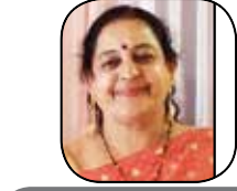
સદગુરુ વચનામૂર્તિ સંકલન ફાળુની વસાવડા (ભાવનગર)

આ વખતે પશ્ચિમ બંગાળના રાજકારણમાં કંઈક મોટું બની રહ્યું છે. વિધાનસભા ચૂંટણી પહેલા ભાજપ અને RSSએ શાંતિથી પોતાનો સૌથી મોટો પ્રચાર શરૂ કરી દીધો છે. સંગઠનો બુધથી સરહદો સુધી એક્ટિવ છે. ભાજપે પશ્ચિમ બંગાળની તમામ 294 બેઠકો પર વરિષ્ઠ નેતા સુખા સ્વરાજની કોમ્પ્યુલા '1 બૂથ - 10 યુથ' ના સૂત્રને લાગુ કર્યું છે. શું છે આ રાજનીતિ, જે બંગાળમાં રાજકીય સમીકરણ બદલી શકે, તેને સમજવા માટે અમે કોલકાતા ગયા. અમે રાજ્યના વિવિધ ભાગોમાં ચૂંટણી વાતાવરણનું અવલોકન કર્યું. અમે તેને સમજવાનો જેટલો પ્રયાસ કર્યો, તેટલું જ ચિત્ર જટિલ બનતું ગયું. લોકો કહી રહ્યા છે કે, 'આ વખતે, રાજકીય વાતાવરણ અને બંગાળનું વાતાવરણ બંને સમાન છે. ક્યારે અને શું બદલાશે તે આગાહી કરવી મુશ્કેલ છે.' કેટલાક માને છે કે મમતા બેનર્જીનું પુનરાગમન લગભગ નિશ્ચિત છે. તેઓ માને છે કે ભાજપની બેઠકો વધી શકે છે પરંતુ સરકાર બનાવવી સરળ નહીં હોય. એક વર્ષ માને છે કે ભાજપની ચૂંટણી ગણતરીઓ કામ કરે છે, તે સત્તામાં પરિવર્તન કોઈ મોટી વાત નહીં હોય.