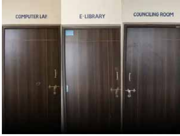
જડપ્પું હોય તેમ આ સ્કૂલની સ્પેશિયલ વીડિયોગ્રાફી કરાવી અને તેનો ન માત્ર રાજકોટ શહેર જ પરંતુ સોરાષ્ટ્રમાં પ્રચાર પ્રસાર કરવામાં આવી રહ્યો છે.

ટેબલ ટેનિસ કોર્ટ, ઈન્ડોર ગેઈમ્સ રૂમ, વોલીબોલ ટ્રેક, કબડ્ડી ગ્રાઉન્ડ અને એથેલેટિક્સ ટ્રેક ઉપરાંત કેન્ટીનની સુવિધા પણ છે. આ સરકારી સ્કૂલ પર જવા માટે સીટી બસની સુવિધા પણ ઉપલબ્ધ છે. રૂટ નંબર 43 અને 86 ની બસ આ સ્કૂલ સુધી જાય છે. લાખો રૂપિયાની ફી ઉધરાવતી ખાનગી શાળાઓને ટક્કર મારે તેવી આ અંગ્રેજી માધ્યમની સરકારી માધ્યમિક શાળા સરકારી સ્કૂલમાં ધો. 1થી 8માં ભણેલા વિદ્યાર્થીઓ માટે આશીર્વાદરૂપ બની રહેશે. પરંતુ શિક્ષણ વિભાગ દ્વારા આ સરકારી શાળાનો પ્રચાર પ્રસાર કરવાનો હોય છે પરંતુ તે બિહુ સામાજિક કાર્યકરોએ