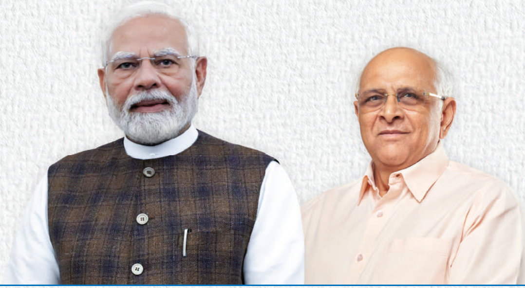
શ્રી નરેન્દ્ર મોદી માનનીય વડાપ્રધાન