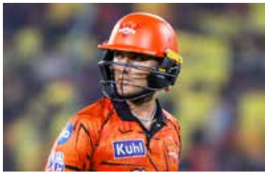
(2024), 16 બોલ: ટ્રેવિસ હેડ vs DC (2024).

અભિષેક હૈદરાબાદ (SRH) માટે સૌથી ઝડપી ફિફ્ટી ફટકારવાનો પોતાનો જ રેકોર્ડ તોડ્યો છે: 15 બોલ: અભિષેક શર્મા vs CSK (2026), 16 બોલ: અભિષેક શર્મા vs MI