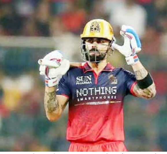
પરિક્કલ, ટિમ ડેવિડ અને સરકરાજ ખાને અડધી સદી ફટકારી અને વિરાટ કોહલીએ 35 રનની ઈનિંગ રમી. દેવદત્ત પરિક્કલ IPL

રોયલ ચેલેન્જર્સ બેંગલુરુ અને ચેન્નાઈ સુપર કિંગ્સ વચ્ચે IPL 2026ની 11મી મેચ બાદ ઓરેન્જ કેપ અને પર્પલ કેપની રેસમાં મોટા ફેરફાર જોવા મળ્યા છે. આ મેચમાં બંને ટીમોએ 457 રન બનાવ્યા અને બીજી તરફ કુલ 13 વિકેટ પણ પડી. વિરાટ કોહલી, સરકરાજ ખાન, દેવદત્ત પરિક્કલ અને ટિમ ડેવિડ જેવા ખેલાડીઓએ IPL 2026માં સૌથી વધુ રન બનાવનારા બેટ્સમેનોની રેસમાં લાંબી છલાંગ લગાવી. બીજી તરફ પર્પલ કેપની રેસમાં પણ ઘણા બોલરોએ છલાંગ મારી છે. તો ચાલો એક નજર તાજેતરની ઓરેન્જ અને પર્પલ કેપ રેસ પર કરીએ.