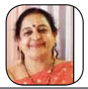
સદગુરુ વયનામૃત સંકલન ફાળુની વસાવડા (ભાવનગર)

જે હવે ‘કર્મયોગી ભવન’, પહેલો માળ, એફ-૧ વિંગ, બ્લોક-૩, સેક્ટર-૧૦-એ, ગાંધીનગર ખાતે કાર્યરત કરવામાં આવી છે. વધુમાં, તમામ સંબંધિત વિભાગો, સંસ્થાઓ અને નાગરિકોને જાણ કરવામાં આવે છે કે હવે પછીનો તમામ પ્રકારનો અધિકૃત પત્રવ્યવહાર ઉપર દર્શાવેલ ગાંધીનગરના નવા સરનામે જ કરવાનો રહેશે.