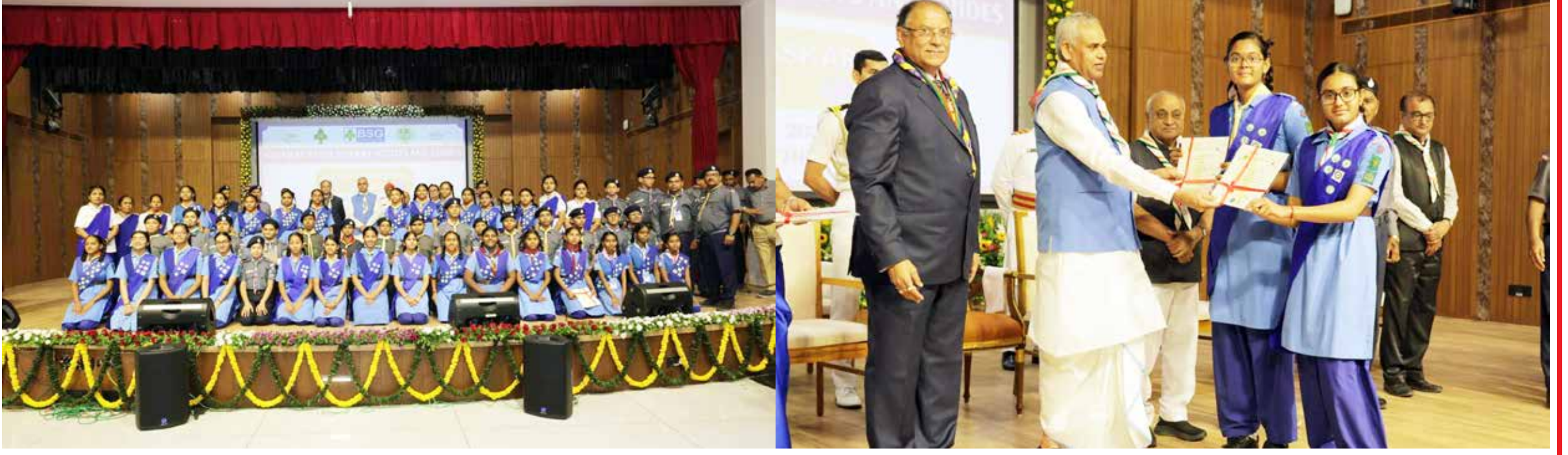
શિક્ષણની સાથે સર્વાંગી વિકાસના ક્ષેત્રમાં અગ્રેસર, કમલપાર્ક, પુણાગામ (વરાછા) સ્થિત નિકેતન સ્કૂલના નામે વધુ એક ગૌરવશાળી સિદ્ધિ જોડાઈ છે. ભારત સ્કાઉટ્સ એન્ડ ગાઈડ્સ, ગુજરાત રાજ્ય દ્વારા આયોજિત કાર્યક્રમમાં શાળાના ૧૪ વિદ્યાર્થીઓને તેમની ઉત્કૃષ્ટ સેવા, શિસ્ત અને કૌશલ્ય બદલ પ્રતિષ્ઠિત 'રાજ્ય પુરસ્કાર' થી સન્માનિત કરવામાં આવ્યા છે. આ પુરસ્કાર ગુજરાતના રાજ્યપાલ દ્વારા પ્રમાણિત હોય છે, જે સ્કાઉટિંગ અને ગાઈડિંગ ક્ષેત્રે રાજ્ય સ્તરનું સર્વોચ્ચ સન્માન ગણાય છે. નિકેતન સ્કૂલના આ વિદ્યાર્થીઓએ કઠિન તાલીમ, કેમ્પિંગ અને સમાજ સેવાના વિવિધ તબક્કાઓ પાર કરીને આ સફળતા પ્રાપ્ત કરી છે. આ પ્રસંગે શાળાના ટ્રસ્ટી મંડળ અને આચાર્યશ્રીએ ઈર્ષ્ય વ્યક્ત કરતા જણાવ્યું હતું કે, 'આ અમારા માટે અત્યંત ગર્વની ક્ષણ છે. અમારા વિદ્યાર્થીઓએ સખત મહેનત અને શિસ્ત સાથે આ મુકામ હાંસલ કર્યો છે. અમે તેમના ઉજ્જવળ ભવિષ્યની કામના કરીએ છીએ અને સ્કાઉટ-ગાઈડના પ્રશિક્ષકો (લીડર્સ) નો પણ આભાર માનીએ છીએ જેમના માર્ગદર્શન હેઠળ આ સિદ્ધિ શક્ય બની છે.'