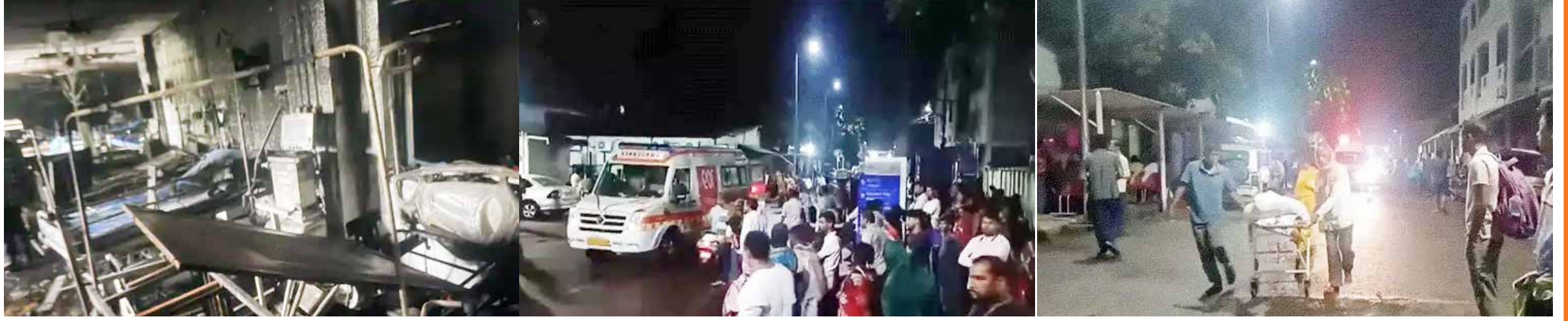
525, તા.16 ઓડિશાના કટકમાં SCB મેડિકલ કોલેજ હોસ્પિટલમાં આગ લાગી હતી. રવિવારે મોડી રાત્રે 3 વાગ્યે થયેલા આ અકસ્માતમાં 10 દર્દીઓના મોત થયા છે. મીડિયા રિપોર્ટ્સ અનુસાર, આગ હોસ્પિટલના પહેલા માળે બનેલા ટ્રોમા કેરના ICUમાં લાગી હતી. દર્દીઓને સુરક્ષિત સ્થળોએ ખસેડતી વખતે હોસ્પિટલના ઓછામાં ઓછા 11 કર્મચારીઓ પણ ઘાજી ગયા હતા. ઓડિશાના CM મોહન ચરણ માંડી ધાયલોને મળવા હોસ્પિટલ પહોંચી ગયા છે. મુખ્યમંત્રીએ મૃતકોના પરિવારોને 25-25 લાખ રૂપિયાનું વળતર આપવાની જાહેરાત કરી છે. સર્કિટના કારણે લાગી હતી. જોકે, CMએ આ ઘટનાની ઉચ્ચ સ્તરીય તપાસના આદેશ આપ્યા છે.

રાત્રે 3 વાગ્યે થયેલા આ અકસ્માતમાં 10 દર્દીઓના મોત થયા છે. મીડિયા રિપોર્ટ્સ અનુસાર, આગ હોસ્પિટલના પહેલા માળે બનેલા ટ્રોમા કેરના ICUમાં લાગી હતી. દર્દીઓને સુરક્ષિત સ્થળોએ ખસેડતી વખતે હોસ્પિટલના ઓછામાં ઓછા 11 કર્મચારીઓ પણ ઘાજી ગયા હતા. ઓડિશાના CM મોહન ચરણ માંડી ધાયલોને મળવા હોસ્પિટલ પહોંચી ગયા છે. મુખ્યમંત્રીએ મૃતકોના પરિવારોને 25-25 લાખ રૂપિયાનું વળતર આપવાની જાહેરાત કરી છે. સર્કિટના કારણે લાગી હતી. જોકે, CMએ આ ઘટનાની ઉચ્ચ સ્તરીય તપાસના આદેશ આપ્યા છે.