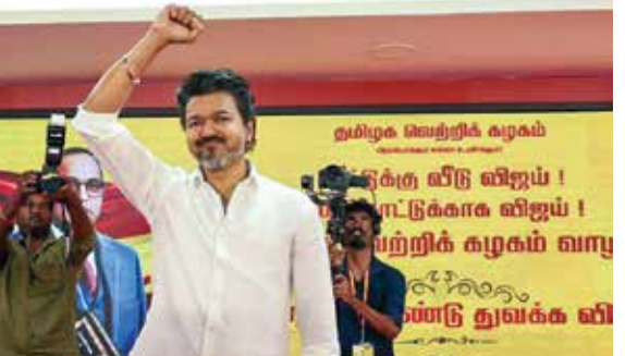
ભાજપના વ્યૂહરચનાકારો માને છે કે, રાજ્યમાં માત્ર 2% મતોનો તફાવત પણ હાર-જીતનું ચિત્ર બદલી શકે છે. વિજયને સાથે રાખીને ભાજપ રાજ્યમાં મજબૂત પકડ બનાવવા માંગે છે. આ માટે ભાજપ અન્ય એક રાજ્યના ડેપ્યુટી CM દ્વારા મધ્યસ્થી પણ કરાવી રહ્યું હોવાનું ચર્ચાઈ રહ્યું છે. બીજી તરફ, ભાજપ સાથે જોડાવાના સમાચારથી વિજયના અંગત સલાહકારો ધિતિત છે. તેમને ડર છે કે, રાષ્ટ્રીય પક્ષ સાથે જોડાવાથી TVKની 'સ્વતંત્ર છબી' ખરડાઈ શકે છે.

તમિલનાડુ વિધાનસભા ચૂંટણી 2026 નજીક આવતા જ રાજ્યનું રાજકારણ ગરમાયું છે. લેટેસ્ટ મીડિયા રિપોર્ટ્સ અનુસાર, અભિનેતામાંથી નેતા બનેલા વિજયની પાર્ટી 'તમિલગા વેટ્ટી કડગમ' (TVK) અને ભાજપ (BJP) વચ્ચે ગઠબંધન માટેની વાતચીત અંતિમ તબક્કામાં ધોવાનું મનાઈ રહ્યું છે. સૂત્રોના જણાવ્યા અનુસાર, ભાજપે વિજયને NDAમાં સામેલ કરવા માટે એક આકર્ષક ઓફર આપી છે. ભાજપે વિજયની પાર્ટીને ગઠબંધનમાં 80 બેઠકો આપવાની તૈયારી દર્શાવી છે. વિજયને રાજ્યના ડેપ્યુટી ચીફ મિનિસ્ટર (ઉપમુખ્યમંત્રી) બનાવવાનો પ્રસ્તાવ પણ મૂકવામાં આવ્યો હોવાના અહેવાલ છે. જો કે, અહેવાલો મુજબ વિજય પોતે મુખ્યમંત્રી પદની ઈચ્છા ધરાવે છે, જેના કારણે હાલ વાટાઘાટોમાં મામલો સમજાઈ રહ્યા છે. તમિલનાડુના રાજકારણમાં વિજયની વિશાળ ફેન ફોલોઈંગ ભાજપ માટે નિર્ણાયક સાબિત થઈ શકે છે.