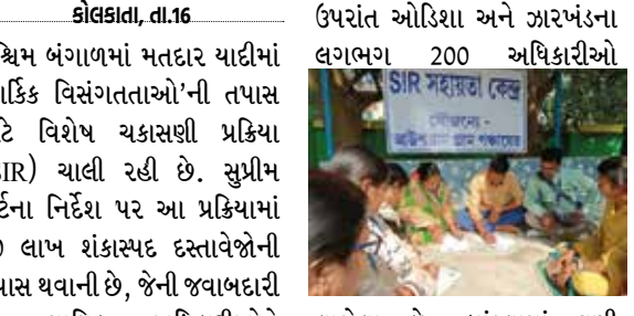
લાગેલા છે. બાંગ્લામાં ઘણી જગ્યાએ કેટલાક ઉપનામ (સરનેમ) બે-બે રીતે લખાય છે. આમાં બેનર્થ કે બંદોપાધ્યાય, મુખર્જી કે મુખોપાધ્યાય અને ચેટર્જી કે ચટ્ટોપાધ્યાય સહિત ઝનબંધ સરનેમનો સમાવેશ થાય છે. અંગ્રેજીમાં બેનર્થને અનુવાદ

કોલકાતા, તા.16 પશ્ચિમ બંગાળમાં મતદાર યાદીમાં 'તાકિક વિસંગતતાઓ'ની તપાસ માટે વિશેષ ચકાસણી પ્રક્રિયા (SAR) ચાલી રહી છે. સુપ્રીમ કોર્ટના નિર્દેશ પર આ પ્રક્રિયામાં 60 લાખ શંકાસ્પદ દસ્તાવેજોની તપાસ થવાની છે, જેની જવાબદારી તે ન્યાયિક અધિકારીઓને સોંપવામાં આવી છે, તેઓ ભારે દબાણમાં છે. પ્રક્રિયામાં સામેલ ઝારખંડથી આવેલા એક ન્યાયિક અધિકારીએ ભાસ્કરને જણાવ્યું-રોજ ઓછામાં ઓછા 300 કેસોનો નિકાલ કરવો પડી રહ્યો છે. પશ્ચિમ બંગાળના 550 અધિકારીઓ ઉપરાંત ઓડિશા અને ઝારખંડના લગભગ 200 અધિકારીઓ દરમિયાન બાંગ્લામાં બંદોપાધ્યાય કરવાને કારણે તેવા નામ તાકિક વિસંગતતાની શ્રેણીમાં આવી ગયા છે. પરંતુ આ ફરક તે જ કરી શકે છે જેને બાંગ્લાનું યોગ્ય જ્ઞાન હોય. બીજા રાજ્યોના મોટાભાગના ન્યાયિક અધિકારીઓ શબ્દોની આ રમતથી અજાણ છે. આ કારણે આવા કેસોમાં ઘણી દસ્તાવેજોની તપાસમાં સમય લાગી રહ્યો છે. ચૂંટણી પંચના સૂત્રોએ પણ સ્વીકાર્યું છે કે ન્યાયિક અધિકારીઓ ભારે દબાણ હેઠળ કામ કરી રહ્યા છે. હજુ પણ લગભગ 48 લાખ લોકોના દસ્તાવેજોની તપાસ થવાની બાકી છે.