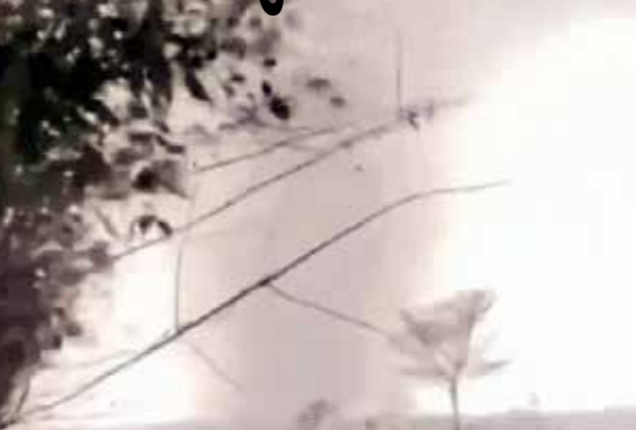
રાજસ્થાનના ઉત્તરીય વિસ્તારોમાં પણ હળવો વરસાદ અને ઝરમર વરસાદ થયો. સિક્કિમના ઘણા વિસ્તારોમાં રવિવારે મોડી સાંજે વાવાઝોડા સાથે ધોધમાર વરસાદ થયો. ઘણી જગ્યાએ મોટા-મોટા વૃક્ષો અને વીજળીના થાંભલા પણ પડી ગયા. રેલોગ કાફર વિસ્તારમાં વૃક્ષ પડવાથી એક મહિલાનું મૃત્યુ થયું. આ તરફ, ઓડિશાના મયુરભંજ જિલ્લામાં રવિવારે એક વિશાળ વાવાઝોડાએ ભારે તબાહી મચાવી. આ ઘટનામાં બે લોકોના મોત થયા, જ્યારે 25 થી વધુ લોકો ઘાયલ થયા. તેજ વાવાઝોડાને કારણે 70 થી વધુ ઘરોને નુકસાન થયું છે. કાશ્મીર, ઉત્તરાખંડ અને હિમાચલ પ્રદેશના ઊંચાઈવાળા વિસ્તારોમાં રવિવારે હિમવર્ષા થઈ. હિમવર્ષાના કારણે શ્રીનગર-લેહ નેશનલ હાઈવેને બંધ કરવો પડ્યો. હવામાન વિભાગના જણાવ્યા અનુસાર, કાશ્મીર અને હિમાચલમાં 21 માર્ચ સુધી હળવો વરસાદ અને હિમવર્ષા થવાની સંભાવના છે.

નવી દિલ્હી, તા.16 દેશના ઘણા ભાગોમાં વરસાદ, કરા અને વાવાઝોડાનો દોર શરૂ થઈ ગયો છે. હવામાન વિભાગે સોમવારે અરુણાચલ પ્રદેશ, આસામ અને મેઘાલયમાં ભારે વરસાદનું એલર્ટ જાહેર કર્યું છે. બિહાર, ઉત્તર પ્રદેશ, છત્તીસગઢ સહિત 18 રાજ્યોમાં વાવાઝોડું, વીજળી અને કરા પડવાની સંભાવના છે. પશ્ચિમ બંગાળ, ઝારખંડ અને ઉત્તરાખંડમાં કેટલાક સ્થળોએ 50-60 કિલોમીટર પ્રતિ કલાકની ઝડપે તેજ પવનોનું એલર્ટ છે. બિહાર, હિમાચલ પ્રદેશ, જમ્મુ-કાશ્મીર, ઓડિશા, સિક્કિમ અને ઉત્તર પ્રદેશમાં વીજળીના કડાકા સાથે 40-50 કિમી/કલાકની ઝડપે વાવાઝોડું ફૂંકાઈ શકે છે. દિલ્હીમાં રવિવારે સવારની શરૂઆત હળવા વરસાદથી થઈ. જેનાથી લોકોને ગરમીથી થોડી રાહત મળી. પંજાબ અને હરિયાણાના ઘણા વિસ્તારોમાં પણ વરસાદ થયો. અમૃતસરમાં મહત્તમ તાપમાન 21.8C અને પટિયાલામાં 26.6C રહ્યું, જે સામાન્ય કરતાં લગભગ 4 ડિગ્રી ઓછું છે.