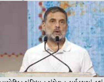
આયોજિત સંવિધાન સંમેલન કાર્યક્રમમાં કહ્યું હતું કે દિલ્હી યુનિવર્સિટી ઇન્ટરવ્યુનો ઉપયોગ વિદ્યાર્થીઓને બહાર કરવા માટે કરે છે. દિલ્હી યુનિવર્સિટીએ સોશિયલ મીડિયા પ્લેટફોર્મ X પર પોસ્ટ કરીને જણાવ્યું કે

દિલ્હી યુનિવર્સિટીએ કોરોસ નેતા રાહુલ ગાંધીના તે નિવેદનને ફગાવી દીધું છે, જેમાં તેમણે આરોપ લગાવ્યો હતો કે યુનિવર્સિટીમાં ઇન્ટરવ્યુ દ્વારા વિદ્યાર્થીઓને બહાર કરવામાં આવે છે. યુનિવર્સિટીએ કહ્યું કે રાહુલ નિવેદન આપતા પહેલા તથ્યોની તપાસ કરે. DUમાં એડમિશન કોમન યુનિવર્સિટી એન્ટ્રન્સ ટેસ્ટ (CUET)ના સ્કોરના આધારે મેરિટથી થાય છે. મોટાભાગના કોર્સમાં ઇન્ટરવ્યુ પ્રક્રિયાનો ભાગ નથી. રાહુલ ગાંધીએ શુક્રવારે લખનઉમાં બહુજન સમાજ પાર્ટીના સંસ્થાપક કાંશીરામની જયંતી પર