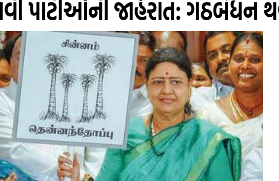
તમિઝના વેન્નિ કઝગમ (TVK), ઉત્તારવાની જાહેરાત કરી છે. બીજી છે તમિલનાડુના પૂર્વ CM

તમિલનાડુમાં વિધાનસભાનો કાર્યકાળ 10 મે 2026ના રોજ પુરો થઈ રહ્યો છે. સામાન્ય રીતે ચૂંટણી કાર્યકાળ પુર્ણ થવાના 4-6 અઠવારિયા પહેલા યોજાય છે. આવી સ્થિતિમાં, ચૂંટણી એપ્રિલના બીજા અઠવારિયામાં યોજાવાની શક્યતા છે. આ વર્ષે યોજનારી ચૂંટણીમાં બે નવી પાર્ટીઓ મેદાનમાં ઉતરી રહી છે. તેમાંથી એક છે અભિનેતા થલાપતિ વિજયની પાર્ટી