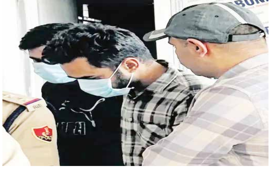
શહાદ બટ્ટીએ ત્રણેય આરોપીઓને એક દિવસ પહેલાં અંબાલાના ત્રણ ટાર્ગેટ જણાવ્યા અને કહ્યું કે તેમાંથી એક જગ્યાએ વિસ્ફોટ કરવાનો છે. આ ટાર્ગેટ હતા - મુલાનાનું માતા બાલા સુંદરી મંદિર, જ્યાં ચેત્ર નવરાત્રીમાં હજારો લોકોની ભીડ પહોંચે છે. બીજો ટાર્ગેટ અંબાલાના એક મોટા નેતાનું ઘર અને ત્રીજો ટાર્ગેટ સૈન્ય ક્ષેત્ર તોપખાનામાં સ્થિત એક સૈન્ય ઠેકાણું હતું. આ અંગેની જાણકારી પોલીસે શનિવારે અદાલતને આપી.

રાજસ્થાનમાં બોમ્બ વિસ્ફોટ માટે પાકિસ્તાન આતંકવાદી શહાદ બટ્ટીએ ષડયંત્ર રચ્યું હતું. બોર્ડર વિસ્તારના જિલ્લા હનુમાનગઢમાં આતંકવાદીએ ઇમ્પ્રુવાઈઝ્ડ એક્સ્પ્લોઝિવ ડિવાઈસ (IED) પણ પહોંચાડી દીધું હતું. આરોપીઓ પહોંચવામાં વિલંબ થતાં આતંકવાદી ષડયંત્ર નિષ્ફળ ગયું. આ ખુલાસો હરિયાણાના અંબાલામાં 2 કિલો આર.ડી.એક્સ, આઈઈડી અને વિસ્ફોટક સામગ્રી સાથે પકડાયેલા