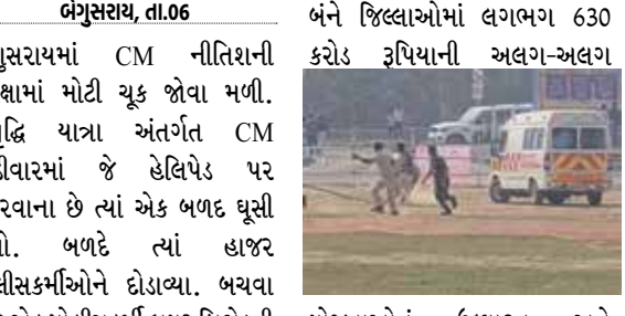
બંને જિલ્લાઓમાં લગભગ 630 કરોડ રૂપિયાની અલગ-અલગ જોજનાઓમાંથી 118.67 કરોડ રૂપિયાની 190 પરિયોજનાઓનો શિલાન્યાસ કરશે, જ્યારે 211.97 કરોડ રૂપિયાની 212 પરિયોજનાઓનું ઉદ્ઘાટન પણ કરશે. આ સાથે તેઓ બિયાડા કેમ્પસમાં કેમ્પા કોલા ફેક્ટરીનો શિલાન્યાસ પણ કરશે. બીઆઈએસીએ કેમ્પસમાં બનાવેલા હેલિપેડ પર હેલિકોપ્ટરથી ઉતર્યા બાદ મુખ્યમંત્રી નિર્માણાધીન મેરિકલ કોલેજની સાથે-સાથે કેમ્પસમાં ચાલી રહેલી વિવિધ ફેક્ટરીઓનું નિરીક્ષણ કરશે.

બેગુસરાય, તા.૦૬ બેગુસરાયમાં CM નીતિશની સુરક્ષામાં મોટી ચૂક જોવા મળી. સમૃદ્ધ યાત્રા અંતર્ગત CM થોડીવારમાં જે હેલિપેડ પર ઉતરવાના છે ત્યાં એક બળદ ઘૂસી ગયો. બળદે ત્યાં હાજર પોલીસકર્મીઓને દોડાવ્યા. બચવા માટે એક પોલીસકર્મી ફાયર બ્રિગેડની ગાડી ઉપર ચઢી ગયો. આનાથી ત્યાં અફરાતફરી મચી ગઈ. બળદને બહાર ભગાડ્યો. મુખ્યમંત્રી નીતિશ કુમારની ત્રીજા તબક્કાની સમૃદ્ધ યાત્રાનો આજે છેલ્લો દિવસ છે. CM આજે બેગુસરાય અને પછી શેખપુર જશે. આ દરમિયાન તેઓ