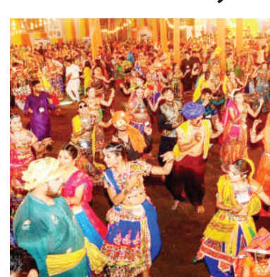
એક્ઝિટ ગેટ રાખવા, જે પરસ્પર વિરુદ્ધ દિશામાં હોવા જોઈએ. મંડપમાં કે પંડાલમાં કોઈપણ પ્રકારની જવલનશીલ સામગ્રી,

જરૂરી દસ્તાવેજોની હાર્ડ ફાઈલ ફાયર એન્ડ ઈમરજન્સી સર્વિસિસ, સેક્ટર-૧૭ ગાંધીનગર ખાતે જમા કરાવવાની રહેશે. સ્થળ નિરીક્ષણ બાદ આ સર્ટીફિકેટ આપવામાં આવશે. માર્ગદર્શિકામાં અનેક મુખ્ય બાબતોનો સમાવેશ કરવામાં આવ્યો છે. આયોજકોએ પંડાલની ક્ષમતા મુજબ જ વ્યક્તિઓને પ્રવેશ આપવો પડશે અને પ્રત્યેક વ્યક્તિ દીઠ ઓછામાં ઓછી ૧ ચોરસ મીટર જગ્યા સુનિશ્ચિત કરવી પડશે. આ ઉપરાંત, મંડપમાં પ્રવેશતા દર્શકો અને ખેલેયાઓનો દૈનિક રેકોર્ડ પણ રાખવાનો રહેશે. ઈમરજન્સીના સમયે લોકો સરળતાથી બહાર નીકળી શકે તે માટે પૂરતા ઈમરજન્સી