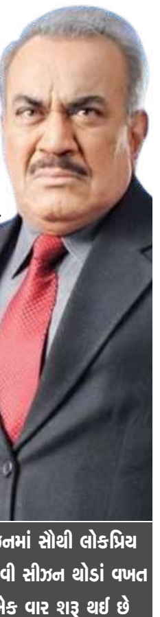
ભારતીય ટેલિવિઝનમાં સૌથી લોકપ્રિય શો સીઆઈડીની નવી સીઝન થોડાં વખત પહેલાં જ ફરી એક વાર શરૂ થઈ છે

ભારતીય ટેલિવિઝનમાં સૌથી લોકપ્રિય શો એસીપીની નવી સીઝન થોડાં વખત પહેલાં જ ફરી એક વાર શરૂ થઈ છે. પરંતુ હવે તેમાં મોટું પરિવર્તન આવવાનું છે, આ શોનું સૌથી લોકપ્રિય પાત્ર ભજવતા શિવાજી સાટમ અન્ય શો અને ફિલ્મોમાં વિવિધ રોલ કરવા છતાં માત્ર એસીપી પ્રધુમ્ન નામથી જ સૌથી વધુ લોકપ્રિય થયા છે. ત્યારે હવે શિવાજી સાટમ આ શો છોડી રહ્યા છે એવા અહેવાલો છે. સોશિયલ મીડિયા પર શિવાજી સાટમ અને તિગ્માંશુ ધુલિયાનો એક વીડિયો પણ વાયરલ થયો છે, જેમાં તિગ્માંશુ શિવાજી સામે બંદુક તાકીને ઉભેલા દેખાય છે. સૂત્રો દ્વારા મળતી માહિતી અનુસાર હવે આ શોમાં એસીપી પ્રધુમ્નને મૃત બતાવાશે. થોડાં વખતથી તિગ્માંશુ ધુલિયા સીઆઈડીમાં ફૂર અને કુખ્યાત આંખ ગંગના લીડર બાબોસાનો રોલ કરે છે. તે આ શોમાં એસીપીને મારી નાખશે. આવનારા એપિસોડમાં સીઆઈડીની ટીમને મારી નાખવા માટે બાબોસા બોમ્બમુકશે એવું બતાવવામાં આવશે. આ બ્લાસ્ટમાં સાઆઈડી ટીમના બાકીના સભ્યો બચી જશે, પરંતુ શિવાજી સાટમ નહીં બચે. હવે એવા અહેવાલો પણ છે કે પ્રોડક્શન હાઉસે આ પાત્ર માટે ઓડિશન પણ શરૂ કરી દીધાં છે. નવા એસીપી માટે ઓડિશન ચાલે છે પણ હજુ કોઈ સિલેક્ટ થયું નથી. એસીપી પ્રધુમ્નના મૃત્યુનો એપિ સોડ શૂટ થઈ ગયું છે અને ટૂંક સમયમાં ટીવી પર આવી જશે. હવે નવા એસીપી કેટલા અસરકારક હશે તે જોવાનું રહેશે.